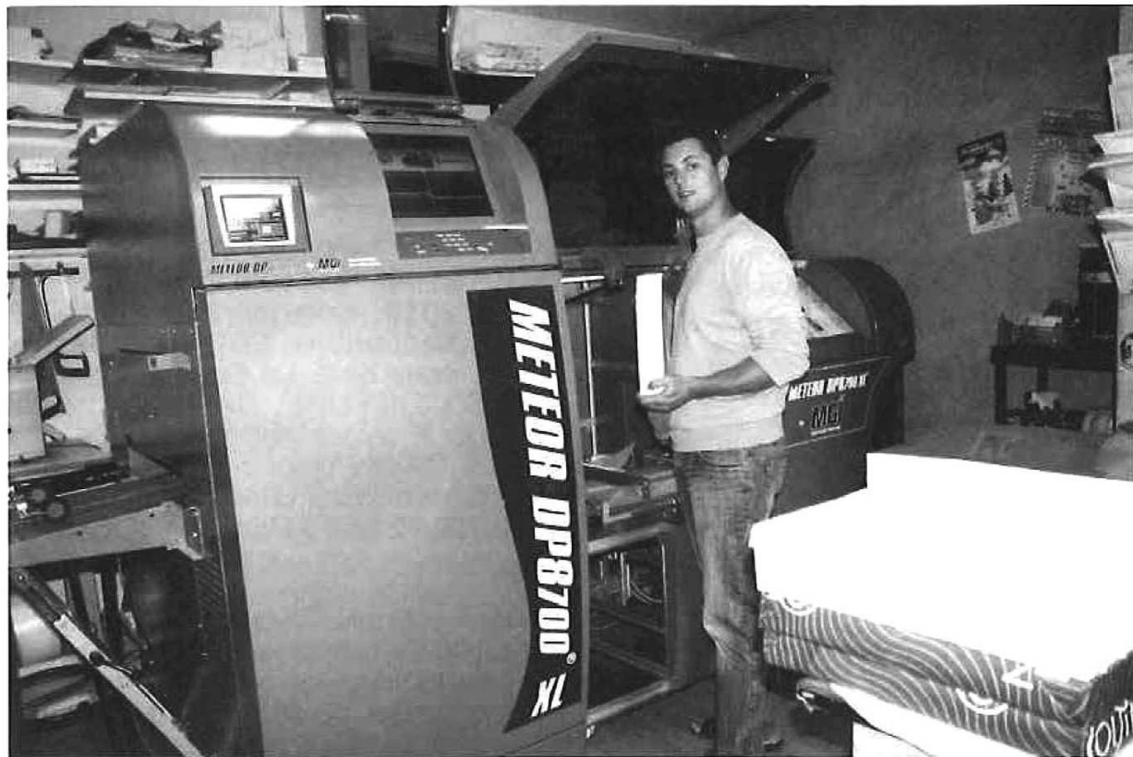
L'impression numérique, incontournable pour survivre

Celles-ci se sont vues couronnées, pour la qualité et l'originalité de leurs réalisations, d'une intervention au cours du Forum International de l'impression numérique « Interquest » à Paris le 17 septembre.