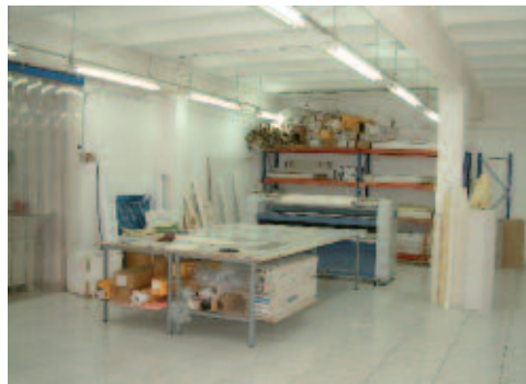
Algunos de los equipos con que cuenta PTGraf.

MGI es una empresa francesa cuya central está en París, y su fábrica está a unos 200 Km al norte de la capital. En Francia cuenta con una cuota de mercado del 30%. Es una empresa muy ágil, con lo cual encajamos muy bien porque OMC es también una empresa ágil. MGI cuenta con una gran experiencia en la impresión digital sobre plástico. En Madrid hemos instalado 4 máquinas de este tipo, y la de PTGraf es la primera de Cataluña”.