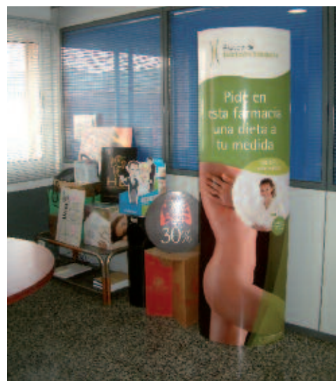
Algunos de los trabajos realizados en PTGraf.

productos, todos artesanos y que requieren procesos muy variados: displays, catálogos, invitaciones, estuchería, carpetería, etcétera. José Pin, administrador de la empresa, explicó que en sus instalaciones se lleva a cabo todo el proceso de producción completo, desde la maquetación hasta la impresión, manipulación y entrega del producto acabado. Los clientes de PTGraf cada vez requieren tiradas más cortas, lo cual ha llevado a su gerente a buscar una tecnología que haga rentable este tipo de producción. Así, el pasado mes de julio, adquirió una máquina de impresión digital Meteor DP 60 Pro de