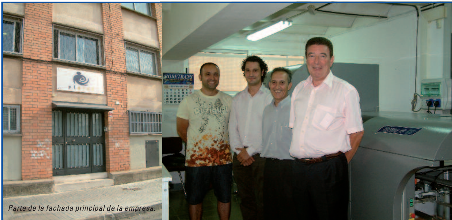
Parte de la fachada principal de la empresa.