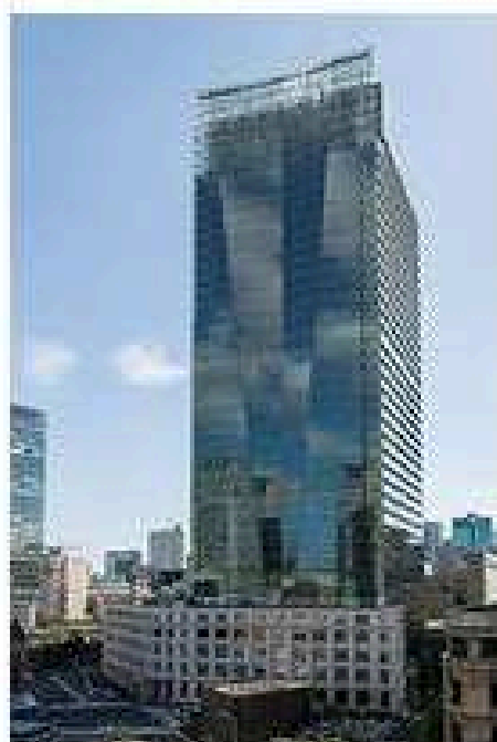
La tour Konica Minolta à Tokyo.

Les deux sociétés coopèrent depuis janvier à la création d'une gamme de machines communes. -