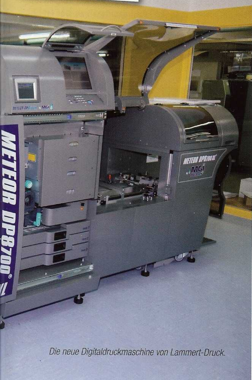
Die neue Digitaldruckmaschine von Lammert-Druck.